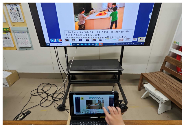
【電磁石アートもおもしろそうだなあ。】