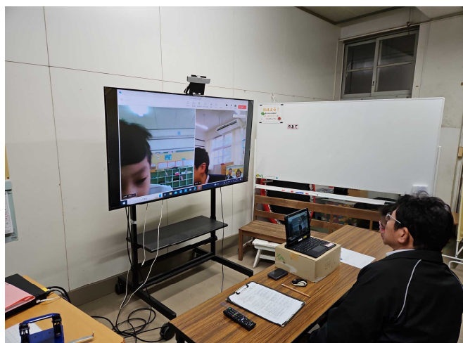
【これから5時間目の学習を始めます。】

○ 1月22日(月)に、ひまわり学級の生活単元学習の研究授業がありました。新城小、柘原小、牛根小の3校をつないだ遠隔授業を行いました。2月に鹿児島市立科学館への合同お別れ遠足の見学計画を立て、発表し合う学習内容でした。4階展示物の中から自分が調べたいものを選び、理由を友達にしっかり説明することができました。発表の後には、自然と拍手がありとても素敵な学習でした。遠足が楽しく、思い出に残るものとなりそうです。楽しみです。