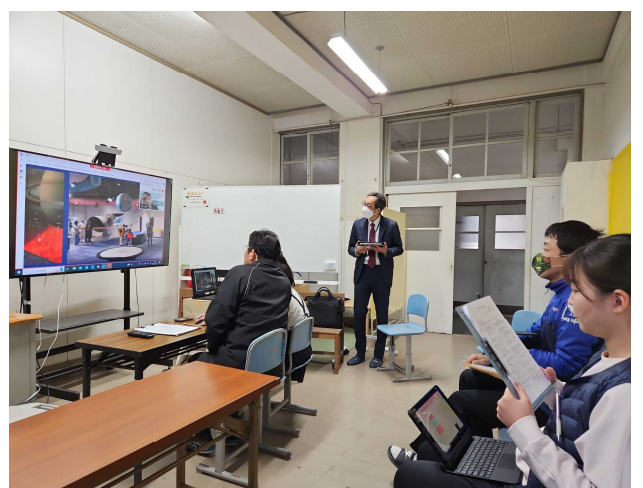
【時間内に見学するには、どうしたらいい?】