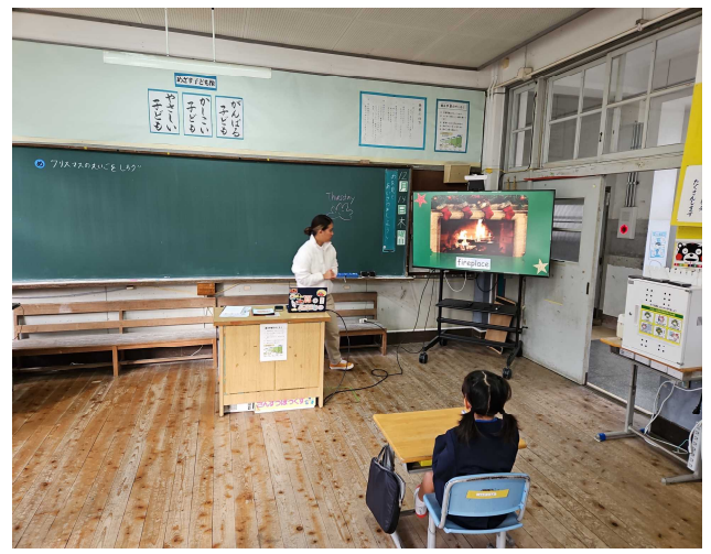
【暖炉は、英語で何というかな？】