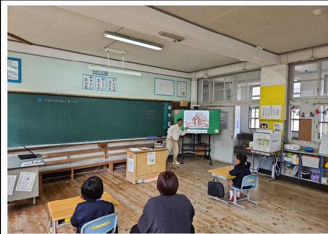
【お菓子の家は英語で何と言うかな？】