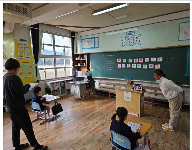
【クリスマスの英語を、おぼえましたか？】