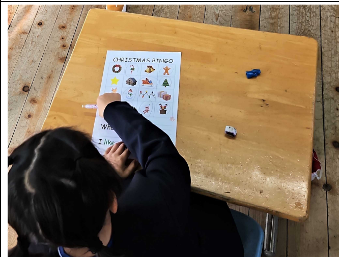
【たてが揃った「ビンゴ」♪】