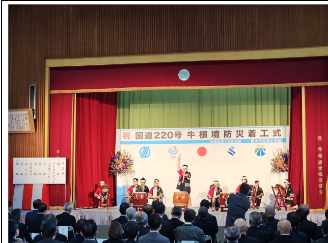
【工事の安全を願って演奏スタート】

○ 12月3日（日）に、国道220号牛根境防災工事着工式にて、牛根太鼓演奏を行いました。子供たちは、工事の安全を願い気持ちを込めて元気よく太鼓を演奏しました。その後、児童全員が鍬入れ式への参加もしました。貴重な体験となりました。道路の完成が楽しみです。♪