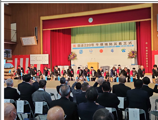
【工事関係者のみなさんと鍬入れ】