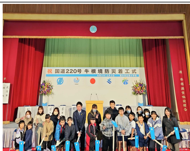
【保護者の皆さんと鍬入れ】