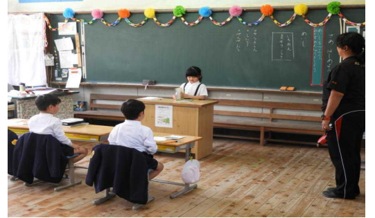
1年生の授業参観の様子