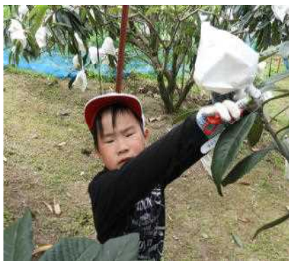
〇うれしいな！びわの収穫