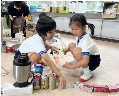
【1・2年生教室 図工授業の様子】

2月2日(金)に、牛根2校集合学習が松ヶ崎小で行われました。国語(討論会)、体育(ティーボール、縄跳び、ボール運動)、図工(ならべて、ならべて)、音楽(茶色の小びん)の学習行いました。合同で学ぶことで、互いに協力したり、高め合ったりする活動を体験することができました。また、節分豆まき集会では「心の鬼退治」を体育館で行いました。鬼の姿に扮した5・6年生に豆を投げ、楽しみながら鬼退治もできました。有意義な集合学習となりました。松ヶ崎小の皆さん、ありがとうございました。