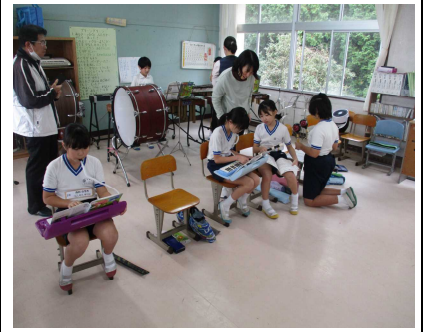
【3・4年生教室 音楽授業の様子】