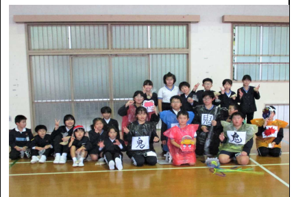
【節分豆まき集会の様子】