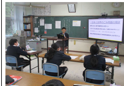
【5・6年生教室 国語の様子】