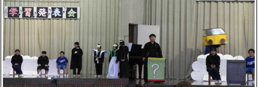
【5・6年雲の上から～社会科劇～①】