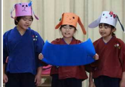
【3・4年うさ忍者たちの大修業①】