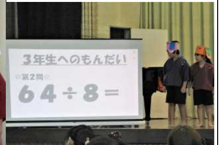
【3・4年うさ忍者たちの大修業②】