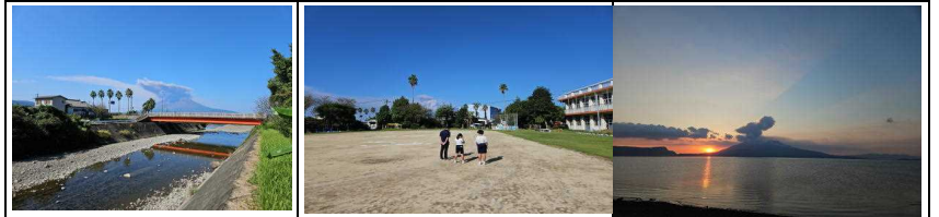
【松崎橋から見た桜織】