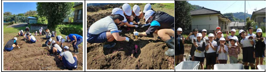
【芋掘り（マルチはずし）】