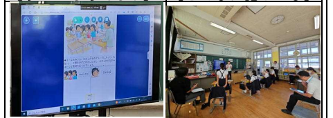
【どんな気持ちかな】