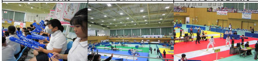
【フェンシング応援】