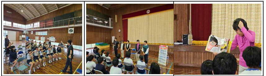
【読書集会（野いちごの方の読み聞かせ）】