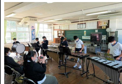
【5・6年生教室の様子】