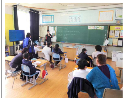
【3・4年生教室の様子】