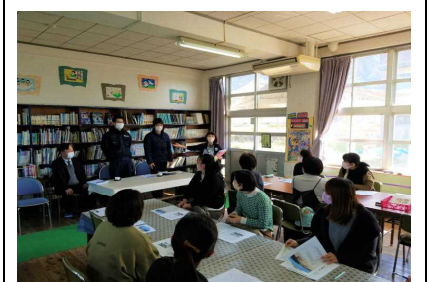
【学校保健委員会の様子】