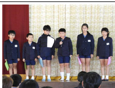
【3・4年「ごみ問題を考えよう」】