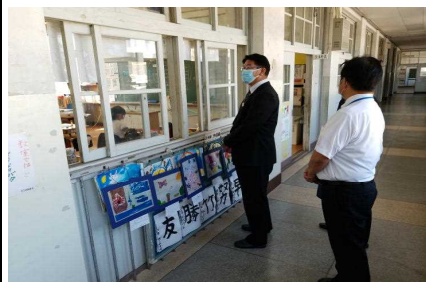
【大隅教育事務所長参観】

11月1日(月)から7日(日)の「地域が育む『かごしまの教育』県民週間」では、保護者・地域の皆様方に、子どもたちの頑張る姿を参観していただきました。「いいところ、頑張っているところ」をたくさん見てもらいたい、張り切っていた子どもたちの姿が印象的でした。参観ありがとうございました。