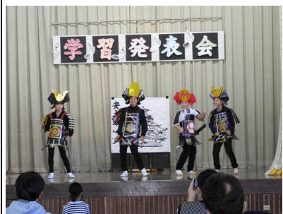
【5・6年「タイムスリップ」】