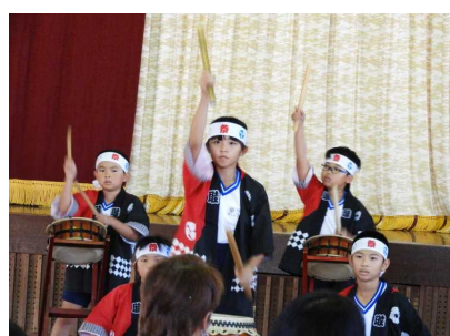
【全児童「ぶち合わせ太鼓2021」】