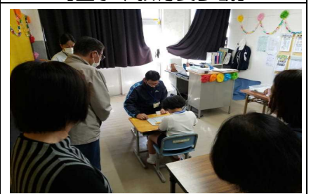
【ひまわり学級：算数】