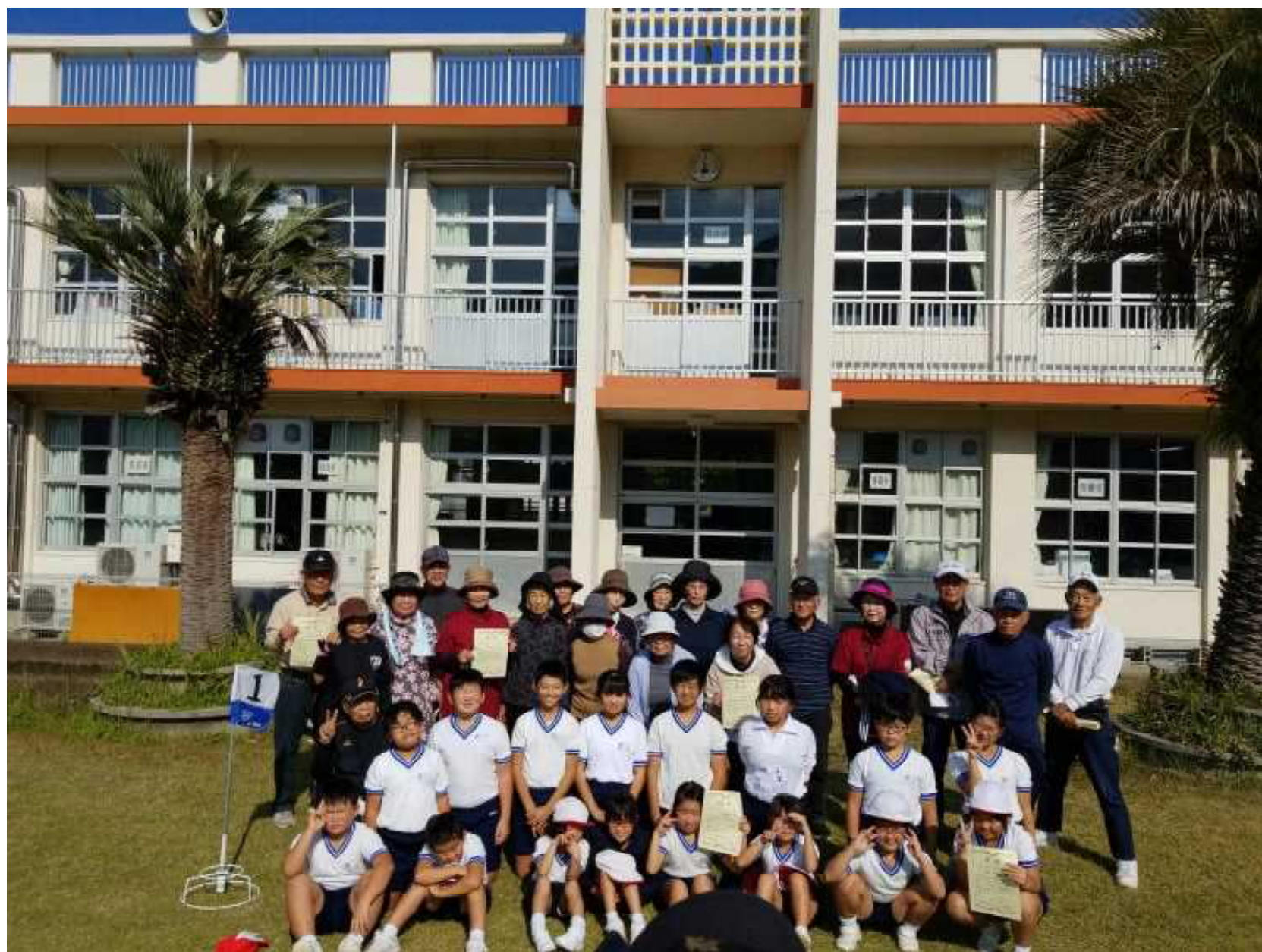
【グラウンドゴルフ大会集合写真】