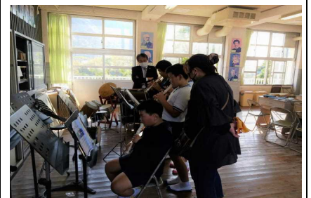
【垂水市教育長参観】