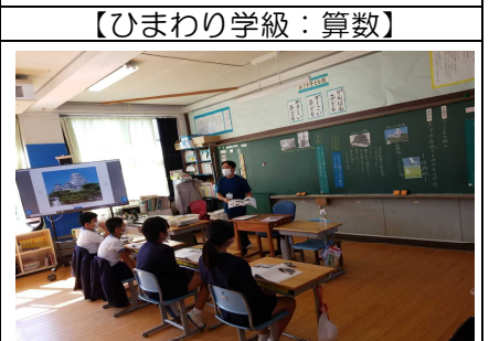
【ひまわり学級：算数】