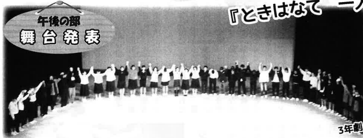
午後の部 舞台発表

11月15日、第11回文化祭が開催されました。コロナ下で制限のある開催となりましたが、舞台、展示ともに、見応えのある素晴らしい発表となりました。