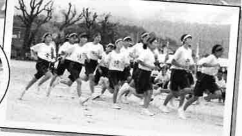
9月13日、コロナウイルス感染対策のため午前中のみ開催となりましたが、各団熱戦が繰り広げられました。