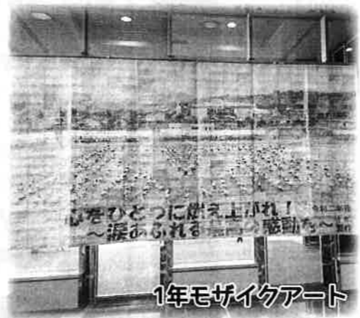
1年モザイクアート