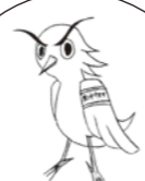
垂水中央中学校 公式イメージキャラ