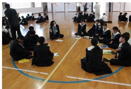
認知症サポーター養成講座【1年】