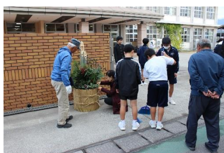
【ボランティア門松づくり】