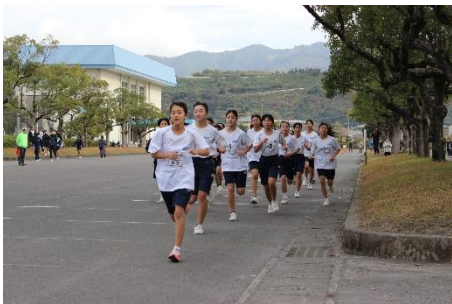
長距離走大会【1年女子】