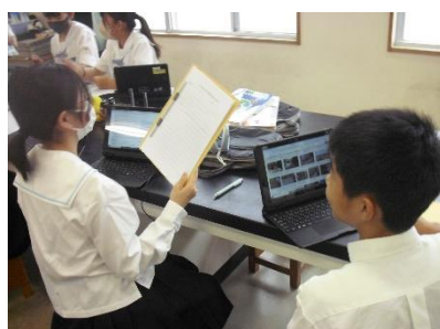
【文化祭の取組 (1年生)】