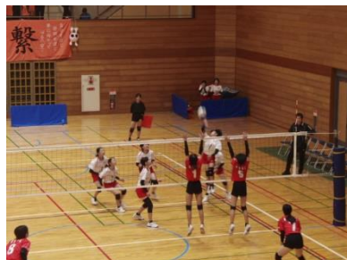
【女子バレーボール】