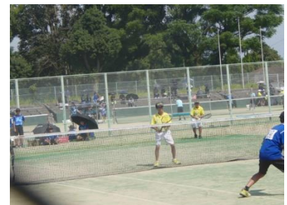
【男子ソフトテニス】