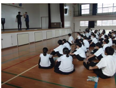
【不審者対応避難訓練】