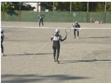
【女子ソフトテニス】