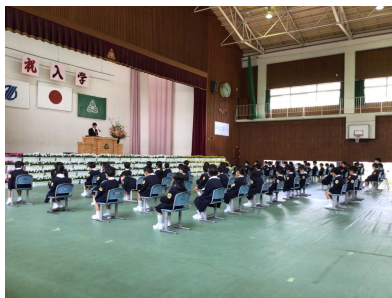
【児童&保護者、教職員での入学式】

「子供のために」。思いは同じです。校訓の「めざす がんばる やりとげる」を胸に刻み、子供のために校長としてさらに前へ進んでいきたいと思っています。