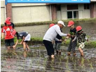
ふるさと先生との田植え

ふるさと先生と「田植え」をしました。11月には実ったもち米を収穫、餅つきをし、美味しくいただきます。人・自然・そして自分たちが生きるためにいただく食物への感謝の気持ちを育みます。