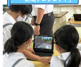
「わたしたちの街 新城プロジェクト」

5・6年生がマイクラフト教育版を使って、未来の街をつくっています。持続可能な社会を目指すための課題に気付き、その解決法を考え、マイクラフトで表現していきます。本校の先進的な取組は、NHKでも紹介されました。これからも、この先必要な生きる学びを進めています。