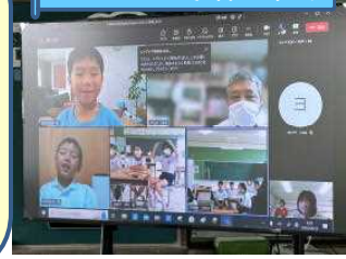
オンライン学習・集会

GIGAスクールでのICT活用が進み、欠席者と学校、違う学校の友達同士と、人をつなぐ、また、集会や発表会に広がりや深まりをもたらすことができるようになりました。1年生も入力の速さ、オンライン授業の実施等、タブレットを操作する力を付けています。