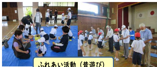
ふれあい活動(昔遊び)

高齢者学級の皆さんに、昔遊びを学ぶ「ふれあい活動」を行いました。竹トンボやお手玉など懐かしい遊びだけでなく、得意なグラウンドゴルフも教えていただきました。子供たちからは、メッセージと育てた花の苗をプレゼントをしました。世代を超えた、とても楽しい交流の時間となりました。ありがとうございました。