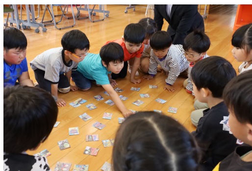
▲ 『垂水かるた』で真剣に遊ぶ園児たち