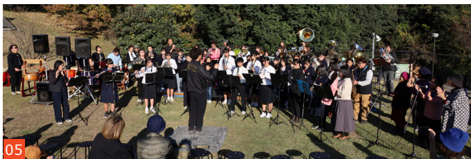
01 ブラックボトムブラスバンドの演奏中の様子 / 02 全身で音楽を楽しむ参加者たち / 03 全出演者とスタッフで記念撮影 / 04 販わうキッチンカー前 / 05 全出演者による合同演奏中の様子