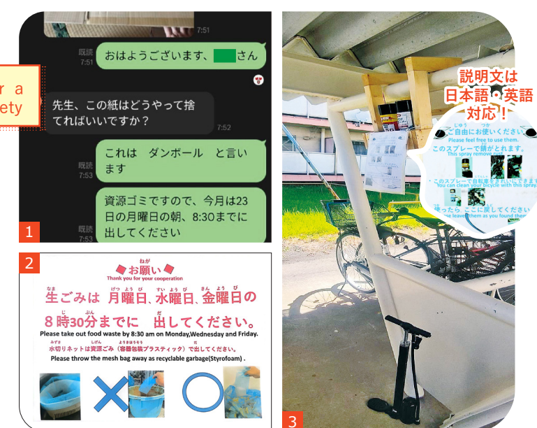
① SNS での相談／② 張り紙作成／③ 自転車のメンテナンススペースを設置