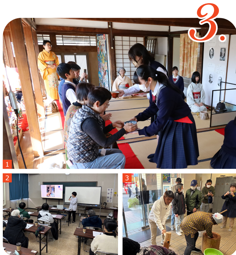
① 新春茶会／② おかたづけセミナー／③ ふれあいもちつき大会(牛根地区)