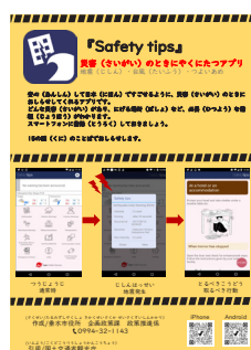
▲ 外国人の方へ配布している紹介チラシ。