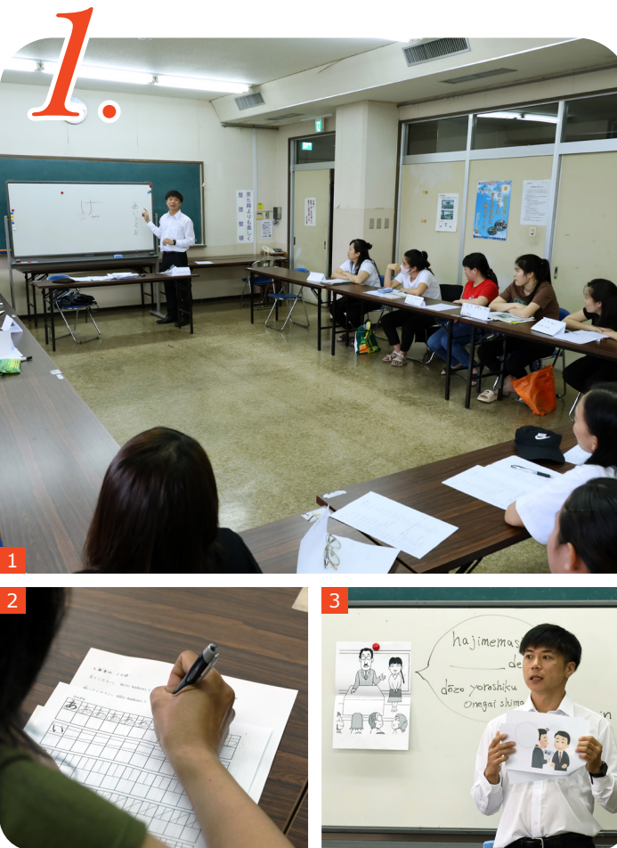
① ② ③ 日本語教室が始まった頃の授業の様子

地域おこし協力隊の多文化共生まちづくりコーディネーターが行ってきた活動について、大きく5つに分けてご紹介します。