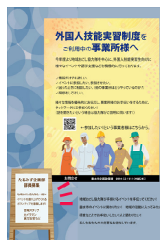
▲ 事業者の方へ配布している紹介チラシ。