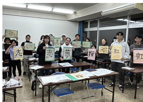
▲ 書道教室で書いた作品と記念撮影

11月27日、垂水市市民館で定期的に開催されている書道教室に、地域おこし協力隊員と一緒に在住外国人のベトナム出身の6人が参加しました。参加した同6人は、毎週1回漢字の勉強会を開くほど漢字に熱意がある方々です。書道教室では、上手に漢字が書けたときは見せて自慢したり、他の人の作品を褒めたりと、とても楽しく充実した時間を過ごしました。