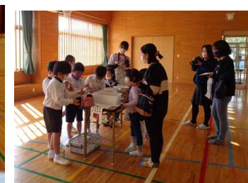
(1,2年生の生活科祭りにはたくさんの保護者の皆様や水之上こども園のみなさんが参加!!)