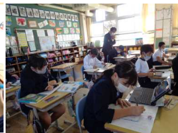
(坂元教育長による授業参観)