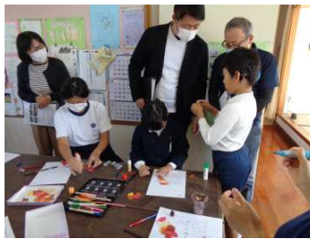
(学校評議員の皆様による授業参観)

11月1日(月)からの「地域が育む『かごしまの教育』県民週間」には、多くの保護者や校区の皆様方に御来校いただきまして誠にありがとうございました。アンケートでいただいた感想や御意見は今後の教育活動等に生かしていきます。