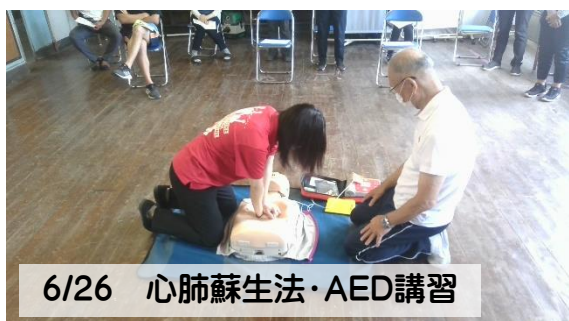
6/26 心肺蘇生法・AED講習