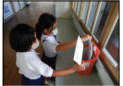
【読書郵便、届くかな？】

基に、子どもたちが本を読む習慣を身に付け、人生を豊かにするために読書が欠かせないものであることを感じられるようにしたいです。