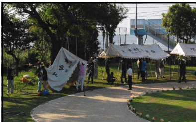
【振興会によるテント設置】

万国旗張りや前日の準備、閉会式後の後片付けまで、大変お世話になりました。本当にありがとうございました。9月はこのように運動会に向けて学校全体が躍動し、子どもたちはいきいきと活動することができました。