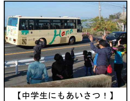
【中学生にもあいさつ！】