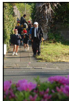
【沿道の花もきれい！】

「あいさつで笑顔あふれる垂水市」の幟（のぼり）やタスキを持って運動をしている大人が、元気よくあいさつする子どもたちに元気をもらったように感じます。