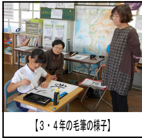
【3・4年の毛筆の様子】