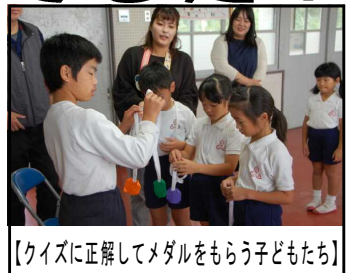
【クイズに正解してメダルをもらう子どもたち】

今後も、「さあ、読もう」と進んで図書室や市立図書館に向かい、本を手に取り、文字に慣れ親しみ、想像力や語彙力を自ら高める子どもの姿を目指します。