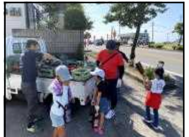
【瓶を回収する様子】

校区の皆様にも空き瓶を出していただく等、子どもたちの活動にご協力いただきました。今後とも子どもたちのことをよろしく願います。