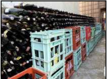
【回収し積み上げられた瓶】