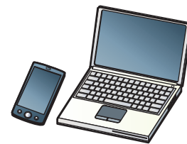
インターネット・気象庁ホームページ