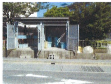
きれいに整理してある垂水市のごみ置き場