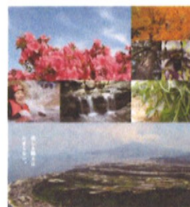
垂水市環境基本計画

この計画の対象地域は、垂水市全域です。また、この計画における環境の範囲は、地球環境、自然環境、生活環境、教育・学習環境です。