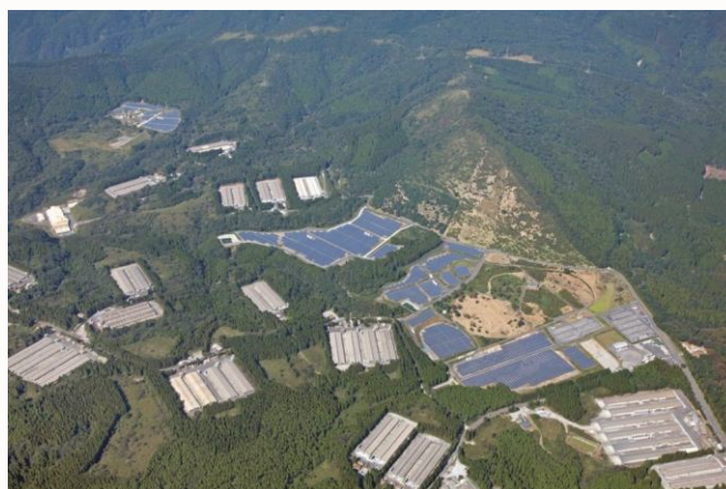
垂水市高峠太陽光発電所