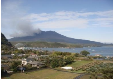
[牛根麓埋没鳥居展望公園からの展望]