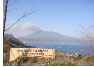
[宇喜多秀家公潜居跡地展望所]