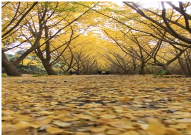
[垂水千本イチョウ園]