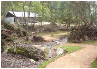
[猿ヶ城溪谷・森の駅たるみず]