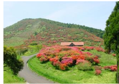
[高峠つつじヶ丘公園]