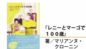
『レニーとマーゴで100歳』著/マリアンヌ・クローニン