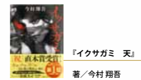
『イクサガミ 天』著/今村翔吾