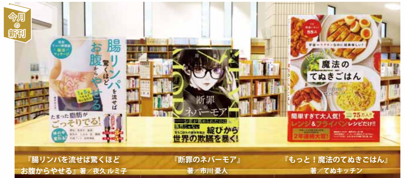
『腸リンパを流せば驚くほどお腹からやせる』著/夜久ルミ子