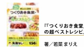
『「つくりおき食堂」の超ベストレシピ』著/若菜まりえ