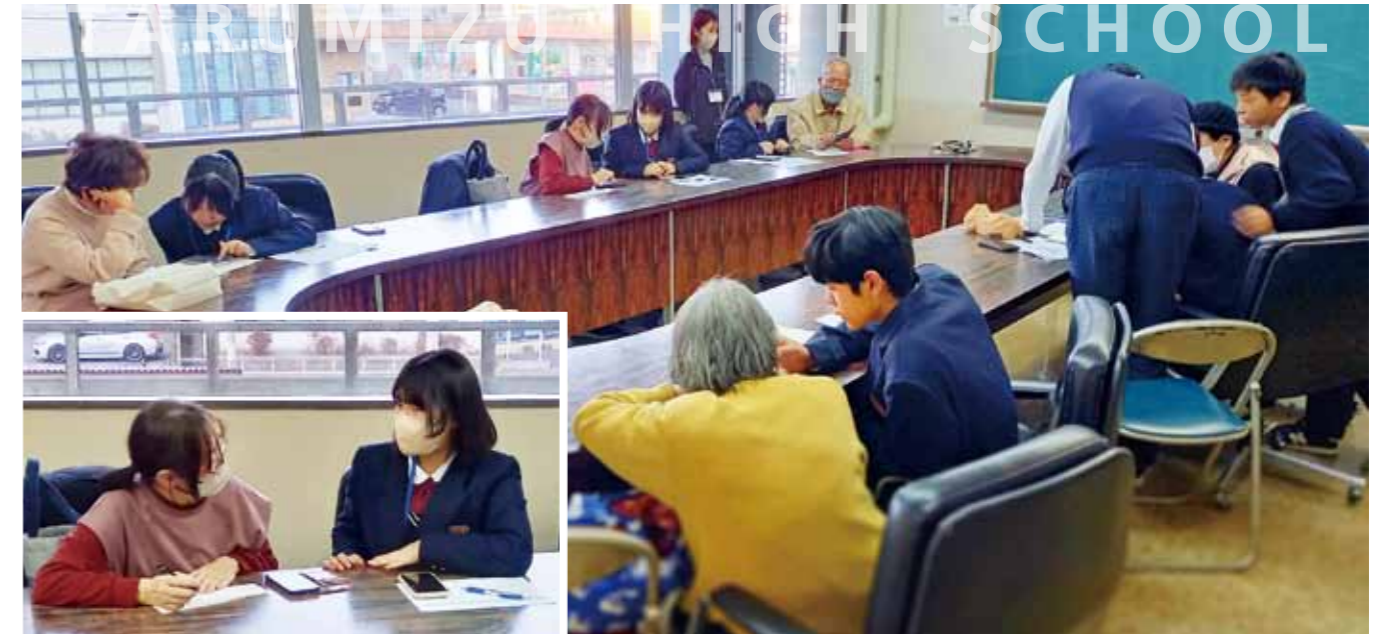
▲2月18日に開催された「令和7年度第4回スマホ教室」の様子です。ご参加ありがとうございました。