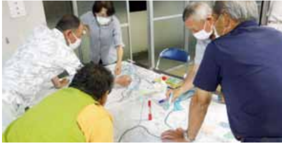
▼作成した地区防災マップ