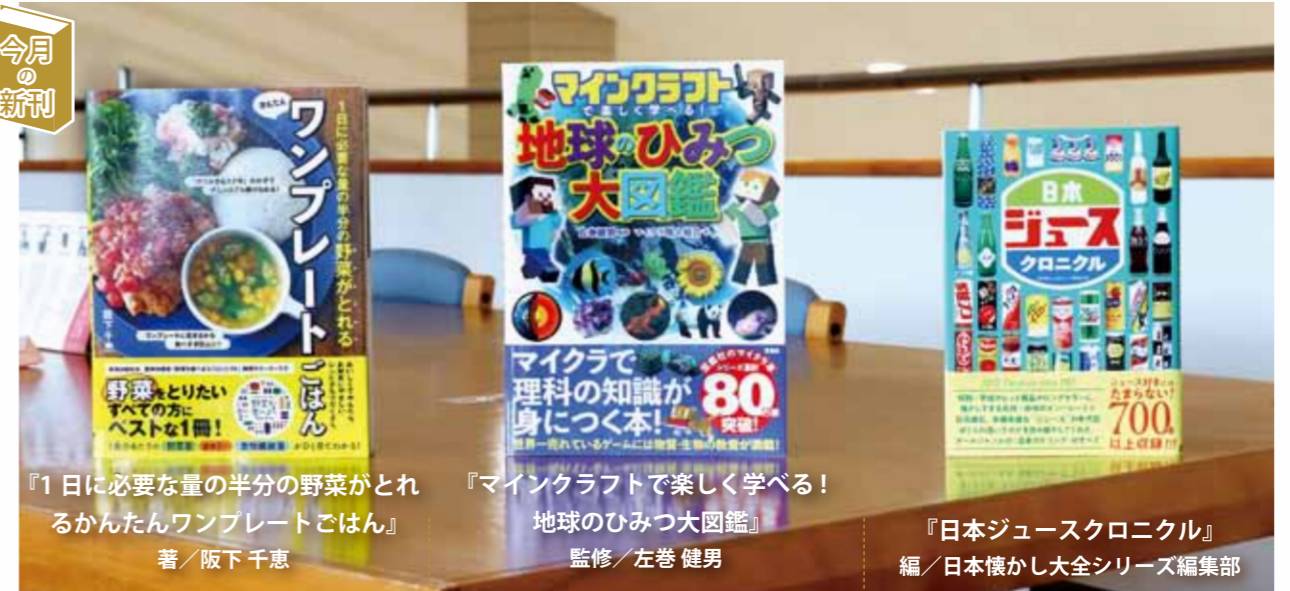
『1日に必要な量の半分の野菜がとれるかんたんワンプレートごはん』 著/阪下千恵