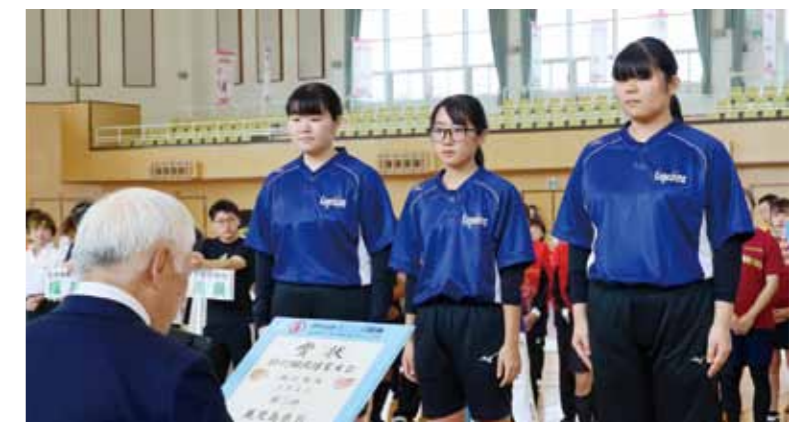
▲少年女子の種目で2位となった鹿児島県B（垂水高等学校）

燃 ゆる感動かごしま国体の公開競技である綱引競技が、8月19日、20日に垂水中央運動公園体育館で開催されました。 同競技は、選手8人（各種目体重の制限があります）で構成され、相手を4メートル引つ張ると勝敗が決します。また、1900年代はじめはオリンピックの種目でもありました。 大会には、全国の各ブロック予選を勝ち抜いた少年男子・女子、成年男子・女子、成年男女混合の合計29チーム、約308人が参加しました。 選手たちは、日頃の練習の成果を発揮し、白熱した試合が展開され、運動会によく目にする同競技の姿はなく、腰を落とし力と技術を駆使した迫力のあるものでした。 同大会には、垂水高等学校の生徒が少年男子・女子に県代表として3チームが出場しました。その様子は、本誌10ページから掲載しています。