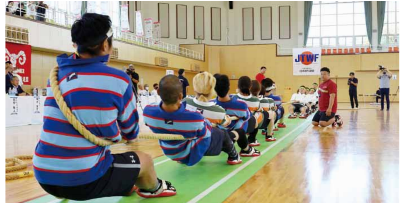
▲チームの最後部に位置する選手はアンカーと呼ばれ、身体に綱を巻いたような持ち方をします。