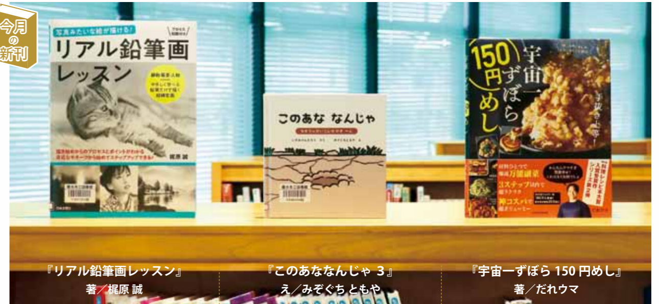
『リアル鉛筆画レッスン』 著／梶原誠