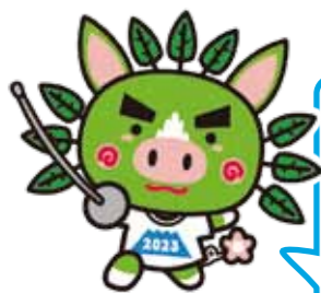
燃ゆる感動かごしま国体マスコットぐりぶーファミリー「ぐりぶー」