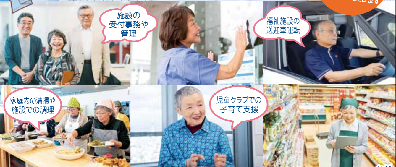
施設の 受付事務や 管理

おおむね 60歳以上の方で 健康で働く意欲のある方 であれば、どなたでも お申込みいただけます