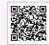
▲インターネット からのご相談は こちら

◎お問い合わせ先 〒 891-2124 垂水市錦江町1番地140 (コスモス苑裏側) ☎ 0994-32-5111 FAX 0994-36-8642 【窓口開設時間】月～金曜日(祝日を除く) 8時30分～17時15分