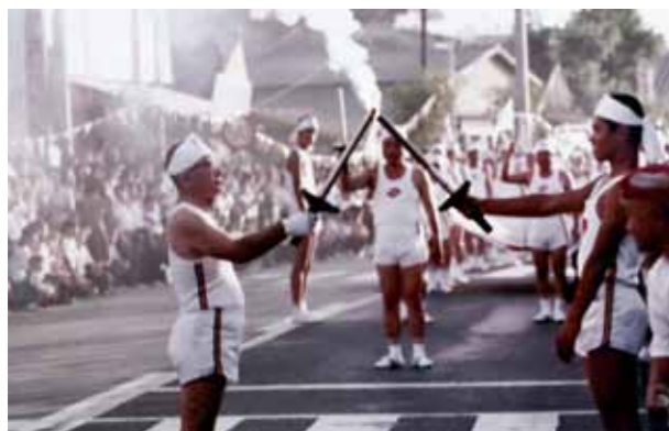
▲昭和47年の太陽国体での炬火リレー写真