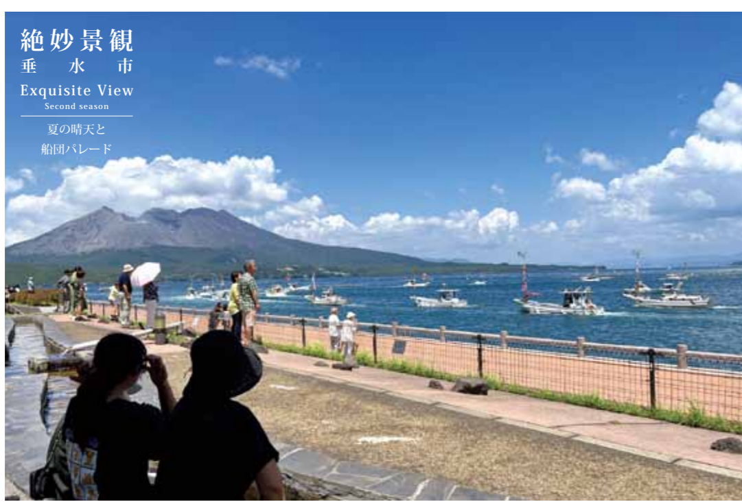
本号 (9月号) 絶妙景観