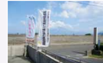
【アクセスのポイント】 垂水中央病院の裏側のコスモス苑と 同じ建物内にあります。 入り口は、海側です。