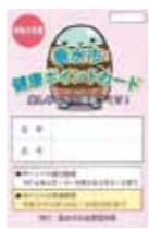
▲令和4年度の健康ポイントカード

○令和4年度健康ポイントカードの交換期限は令和5年9月29日まで! 令和4年度健康ポイントカードをお持ちで、5ポイント以上貯まっている方は、垂水スタンプ会商品券の引換券と交換できますので、交換期限までに申請をお願いします。 ※交換期限を過ぎると申請できませんので、お忘れなくお手続きください。 ●交換申請場所 ・垂水市役所市民課国保係 ・新城支所、牛根支所 ●交換に必要なもの ・令和4年度健康ポイントカード