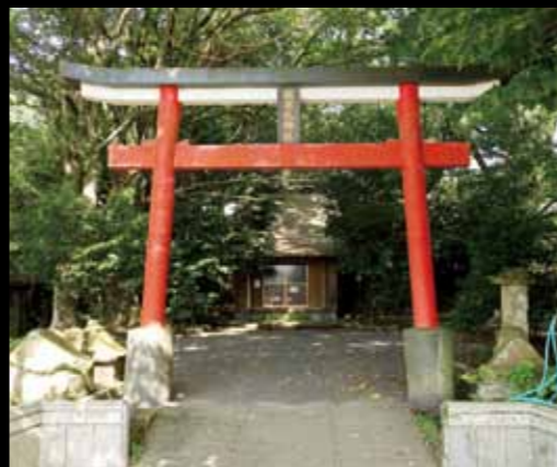
▲現在の飯牟礼神社

島津家の御祭神であり、県内はもちろん、全国に在る神社の3分の1は、稻荷神社と言われるほどあります。