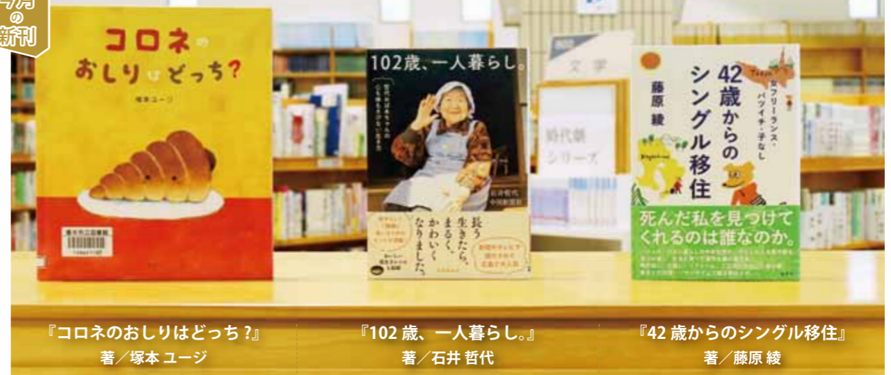
『コロネのおしりどっち?』 著/塚本 ユージ