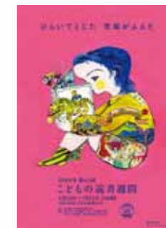
2023・第65回「こどもの読書週間」ポスター

「こどもの読書週間」は、『こどもたちにもっと本を、もっと本を読む場所を』という願いから誕生した取り組みです。垂水市立図書館には、最新の児童書から懐かしい一冊まで幅広く揃っていますので、ぜひご利用ください。