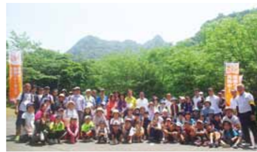
▲昨年度の集合写真 コース / 水之上三和センター ⇄ 猿ヶ城溪谷 (約11km)