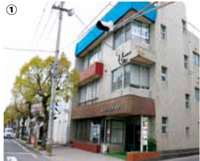
① FM たるみずは、平成 26 年に市役所別館 3 階に移設されました。