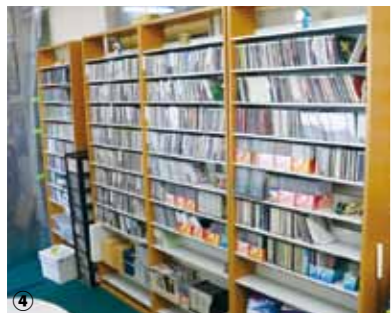
④ 約 2,000 枚の CD。ほとんどがリスナーの方々などからいただいたもの。