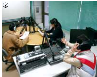
② 開局当初の様子。平成 21 年 5 月より市政情報の発信が始まりました。