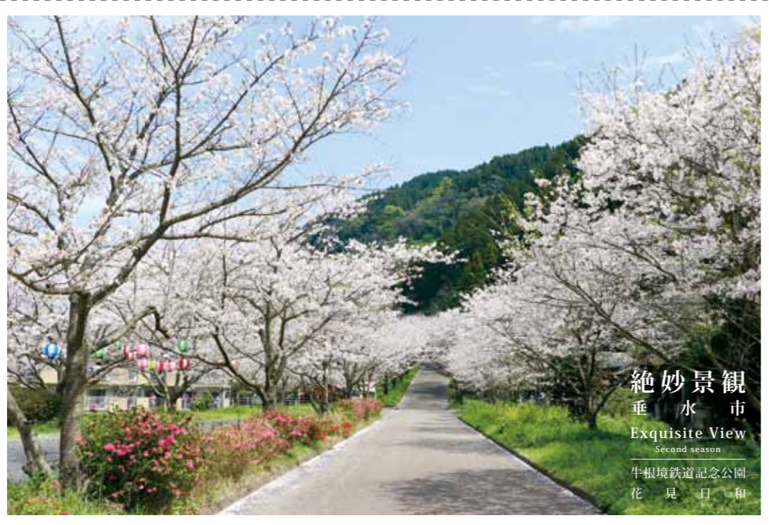
絶妙景観 垂水市 Exquisite View Second season 牛根境鉄道記念公園 花見日和