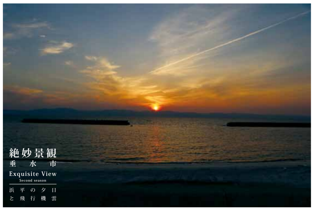
絶妙景観 垂水市 Exquisite View Second season 浜平の夕日 と飛行機雲