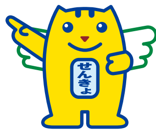
▲明るい選挙キャラクター「選挙のめいすい(明推)くん」

◆垂水市議会議員選挙立候補予定者説明会 ■開催／平成31年3月13日(水)午後1時30分 ■場所／垂水市市民館2階大会議室