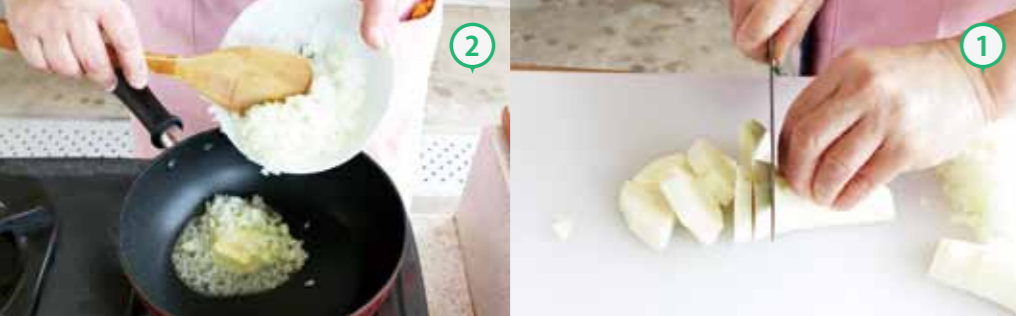
①パースニップは皮をむき、いちょう切りにし、玉ねぎとパセリは、みじん切りにする。