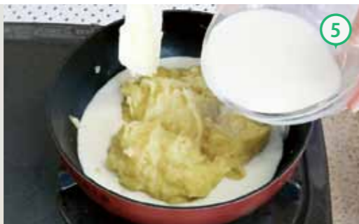
⑤牛乳・生クリームを加え、火にかける。よく混ぜて温め、塩・こしょうを加えて味を調える。