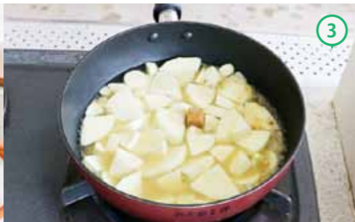
③玉ねぎがしんなりしたらパースニップ、コンソメ、水を加える。（沸騰したら中火にする）