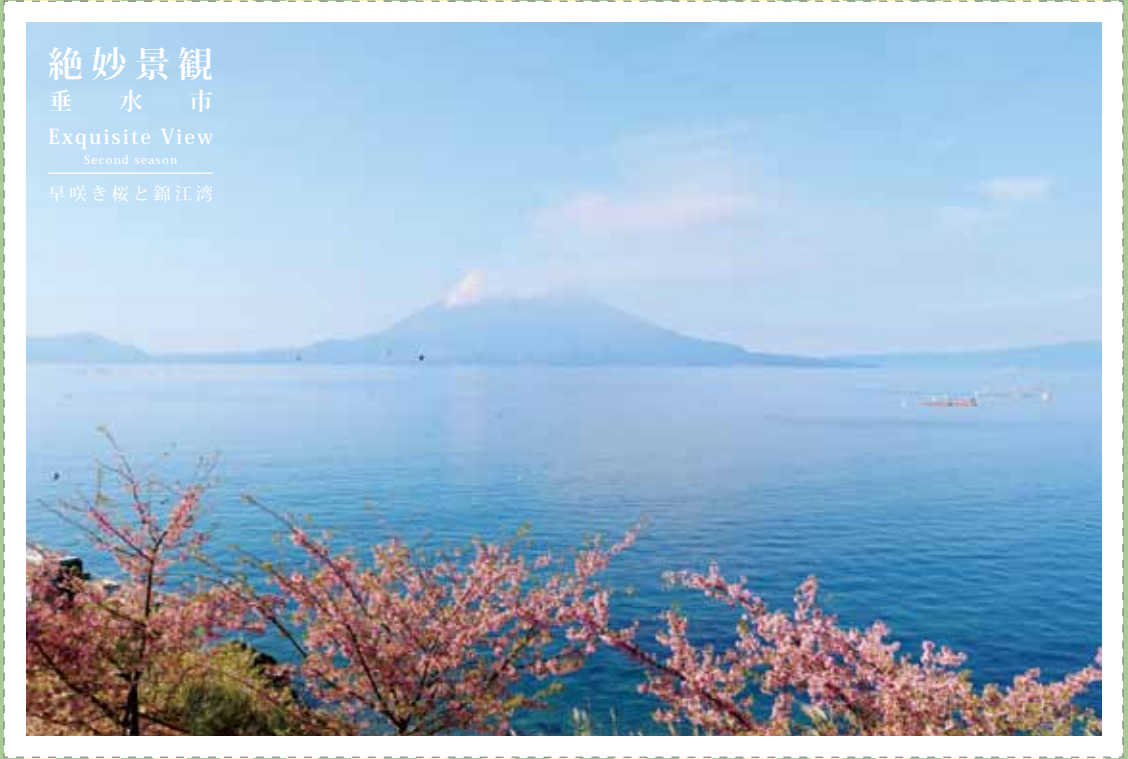
絶妙景観 垂水市 Exquisite View Second season 早咲き桜と錦江湾