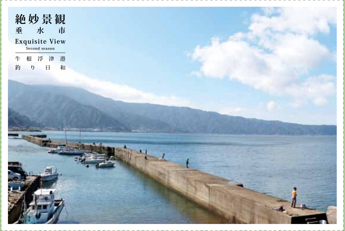
絶妙景観 垂水市 Exquisite View Second season 牛根浮津港 釣り日和