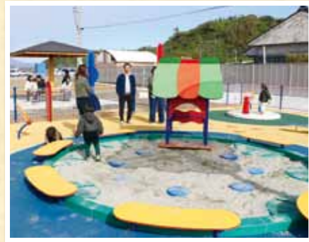
▲囲いの中で安心して遊ばせられる幼児用遊具

道の駅本館施設以外にも「たるたる」がシンボルのこども広場、来春には、肉・魚直売所、マリンスポーツ施設などがオープン。