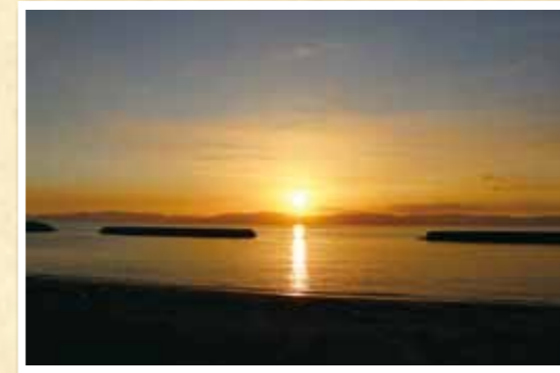
▲対岸に夕日が沈む景観

カフェ、レストランでは、こだわりのコーヒーや食事ももちろん、店内からは、錦江湾の景観も楽しめます。また、2階にある展望デッキでは、180度開けた視界から、晴れた日は、右手に桜島、左手に開聞岳を臨むことができます。夕暮れ時は、対岸の薩摩半島に沈む夕日が海面をオレンジ色に染め、その様子は、まさに絶景です。