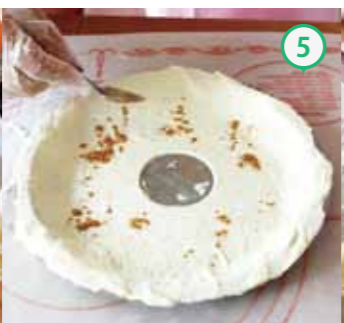
⑤ パイ生地にシナモンをふりかける