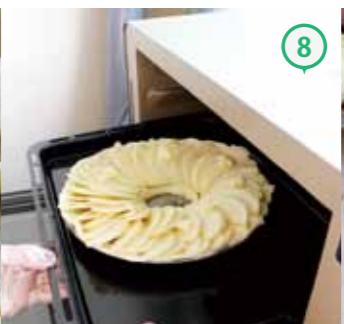
⑧ 予熱した200°Cのオーブンで15分、その後170°Cで20分焼く。