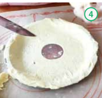
④ フォークで全体に穴をあけ、中央を丸く切り取る