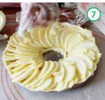
⑦ ⑥にりんごを並べ、グラニュー糖、バターを散らす。