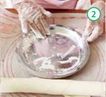
② パイ皿にうち粉をし、①のパイ生地をのせる