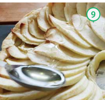
⑨ 焼き上がりに、はちみつを塗ると・・・