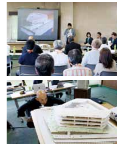
▲審査会プレゼンテーションの様子

佳作 (株)東条設計 (株)アブルデザインワークショップ (有)ナスカ (株)遠藤克彦建築研究所