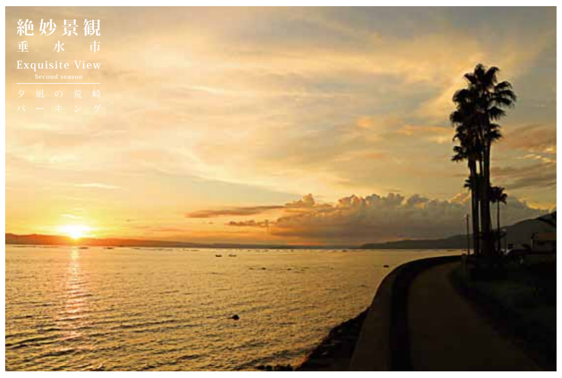
絶妙景観 垂水市 Exquisite View Second season 夕風の荒崎 パーキング