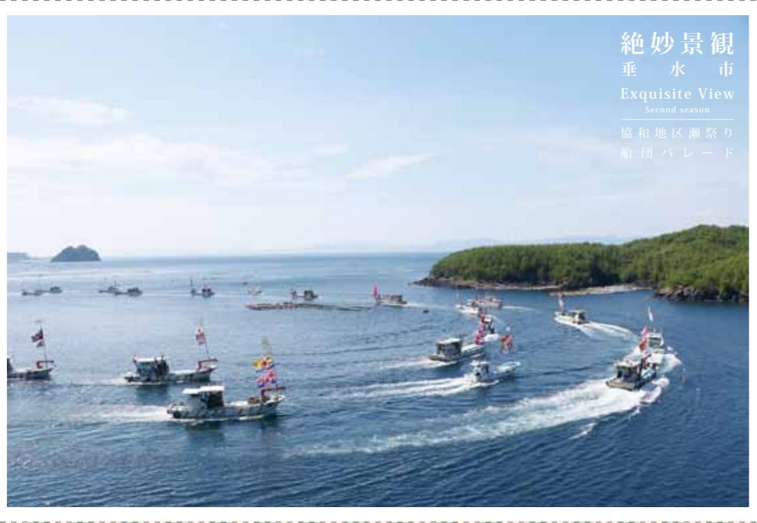
絶妙景観 垂水市 Exquisite View Second season 協和地区瀬祭り 船団パレード