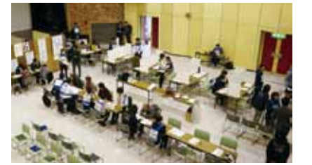
▲市民館での健康チェック会場の様子

●垂水市地域包括ケアセンター（垂水市保健課地域包括ケア係）へ FAX またはお電話で申し込み。