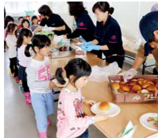
垂水市漁協青年部 園児たちに食育学習

11月7日（火）、垂水市漁業協同組合青年部による魚食普及のための食育学習が行われました。年に3回ほど市内の幼稚園・保育園児を対象に行っており、今回はカトリック幼稚園の園児44人が参加しました。当日は、施設見学や魚についてのお話の後、昼食に同漁協特製「カンパチバーガー」と「カンパチのはさみ揚げ」を食べました。同青年部では、この他、アマモの保全活動や海の清掃活動など、海を守り、水産業の理解・増進のための活動を行っています。