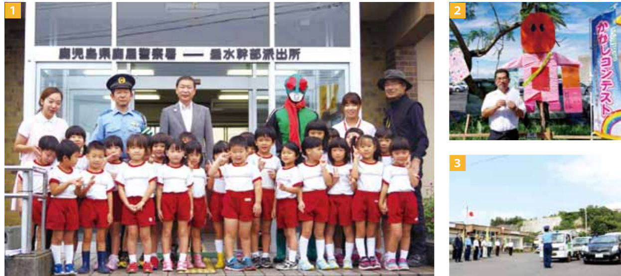
1 / 秋の全国交通安全出発式 2 / 交通安全かかしコンテストで金賞となった松ヶ崎小学校の作品 3 / 全国地域安全運動出発式

秋の全国交通安全運動（9月21日～30日）・平成29年度全国地域安全運動（10月11日～20日）が実施され、市内でさまざまな取組が行われました。秋の全国交通安全運動では、垂水幹部派出所で出発式が行われ、カトリック幼稚園園児達による交通安全宣言の後、パトロール車両が交通安全の広報活動へ出発しました。道の駅たるみずでは交通安全かかしコンテストが開催され、国道沿いに市内小学校の児童が作ったかかしが展示されました。また全国地域安全運動でも、垂水幹部派出所で防犯パトロール隊などが参加し出発式が行われ、街頭キャンペーンではうそ電話詐欺等への注意を呼びかけました。