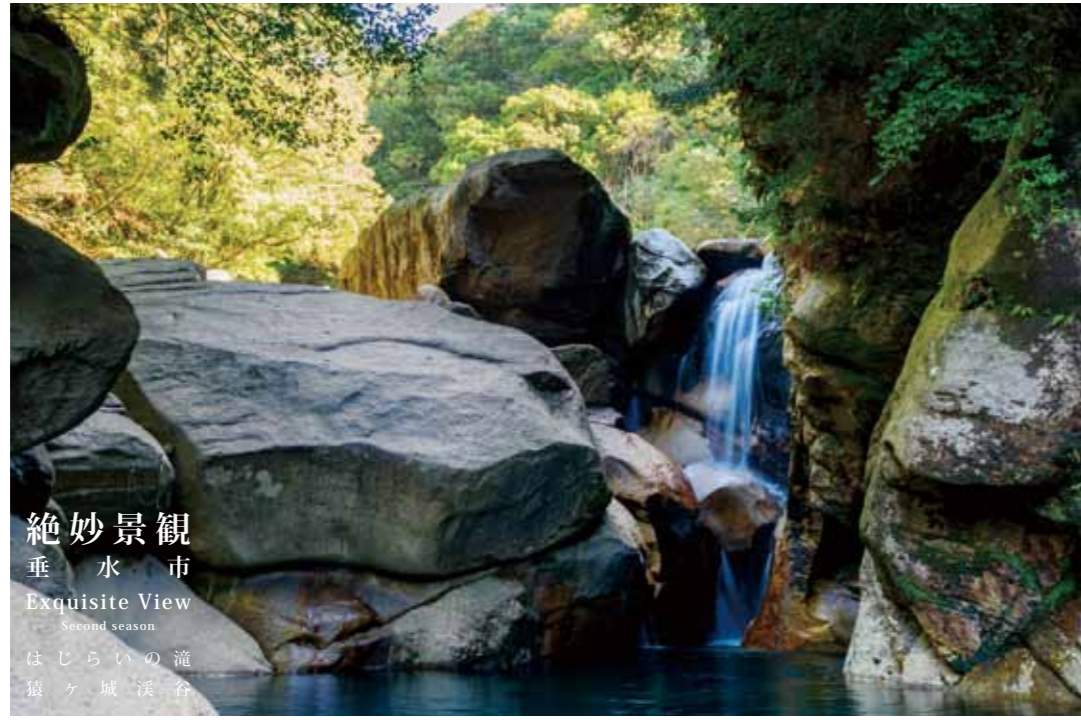
絶妙景観 垂水市 Exquisite View Second season はじらいの滝 猿ヶ城溪谷