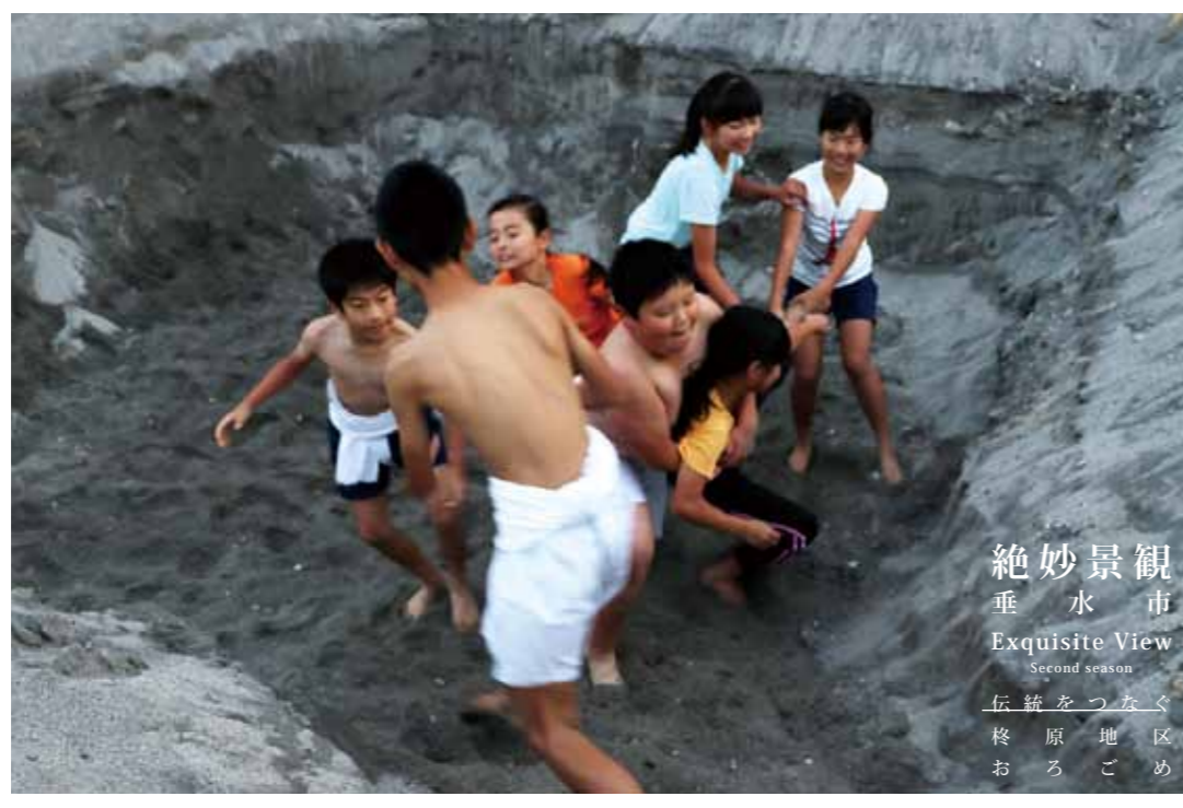
絶妙景観 垂水市 Exquisite View Second season 伝統をつなぐ 終原地区 おろごめ